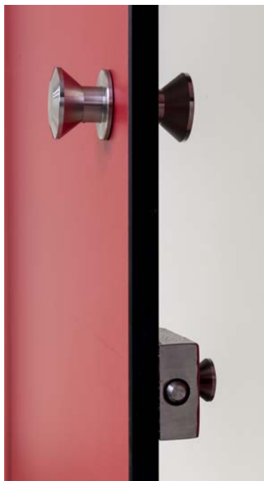
Manija y cerradura