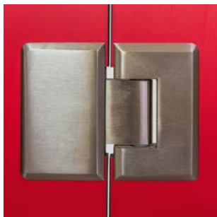
Bisagra doble apertura