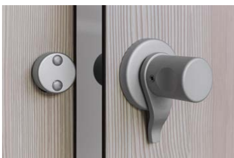
Manija y cerradura