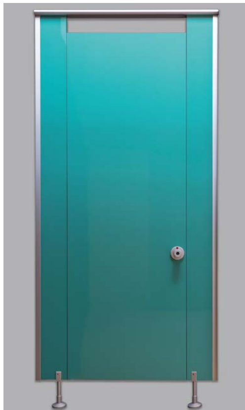
Frente de cabina

Este sistema tiene una altura estándar de 2050 mm (contando las patas). Puede llegar a 3000 mm, según solicitud especial del cliente.