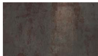
Terra Steel 3116